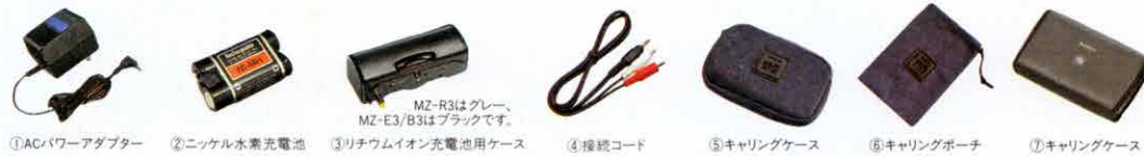
①ACパワーアダプター ②ニッケル水素充電電池 ③リチウムイオン充電電池用ケース ④接続コード ⑤キャリングケース ⑥キャリングポーチ ⑦キャリングケース